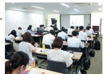
セミナー受講風景